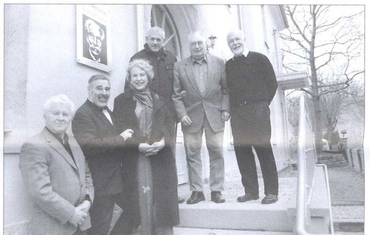
Mitglieder des Albert Schweitzer Komitees und des Freundeskreises am Eingangsbereich